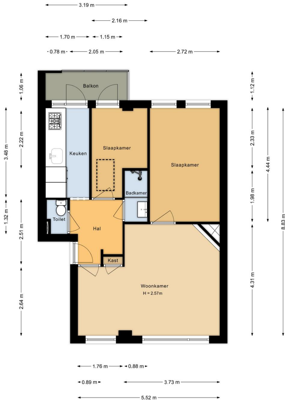
Appartement Johan de Meesterstraat 13-2 Haarlem